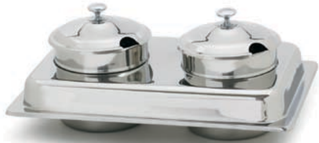
ROY COH SS 2

Acier inoxydable • Style élégant • Couvercle bombé Poignées en laiton • Récipients pour la nourriture et l'eau • Capacité de 8 qt Cadre robuste soudé • Deux porte-brûleurs