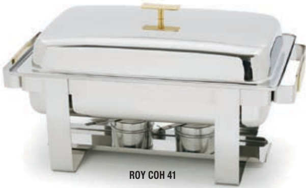
ROY COH 41