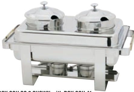
ROY COH SS 2 SHOWN with ROY COH 41 Illustré : ROY COH SS 2 avec ROY COH 41

Converts Most Standard Oblong Chafers To Soup Station Mirror Finished Stainless Steel Construction Complete with Two Custom Sized 4 Quart Inset Notched Lids with Knob Handles